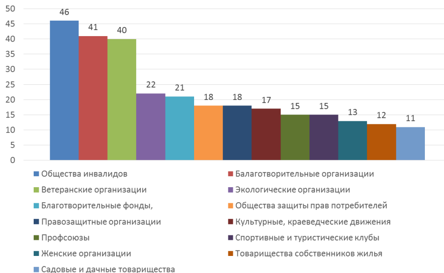
Рисунок 2 – Степень популярности общественных организаций

По оценкам населения, именно эти организации в убывающем порядке должны пользоваться большими благами и быть в приоритете у власти именно для них по оценкам населения должны создаваться благоприятные условия. Что касается последних в этом списке, то их позиция объясняется тем, что данные организации и их деятельность чаще ассоциируется с негативным эмоциональным фоном, транслируемом через СМИ и социальные сети.